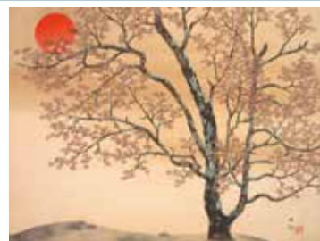
横山大観《春朝》山種美術館