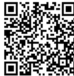
新規登録用QRコード